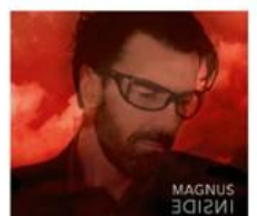
Magnus Inside Das-Magnus-Music / Sony Music / VO 26.05.17

auf diesem Album ausschließlich international renommierte Musiker zu hören, die mit internationalen Größen wie Elton John, Sting oder Queen bereits zusammen gearbeitet haben. Bereits 5 Singles wurden aus dem Album ausgekoppelt. Bei INSIDE kommt niemals Langeweile auf, denn jeder Song ist ein Unikat mit eigener Geschichte und Klangkraft! Ungewöhnlich starke Harmonien und eingängige Melodien führen zu Songs mit großem Potential. Eingängige Refrains überzeugen, und die anspruchsvollen, mit einer starken Botschaft versehenen englischen Texte passen perfekt zum Stil der Musik, ohne dabei kompliziert zu sein. INSIDE und der Künstler Magnus verblüffen die Fans mit einer neuen Vielfalt und ungewöhnlichem Sound. Dieser Künstler ist anders als andere, ein neuer ungewöhnlicher Stil mit großer Qualität. Dieses Album sollte man sich nicht entgehen lassen!